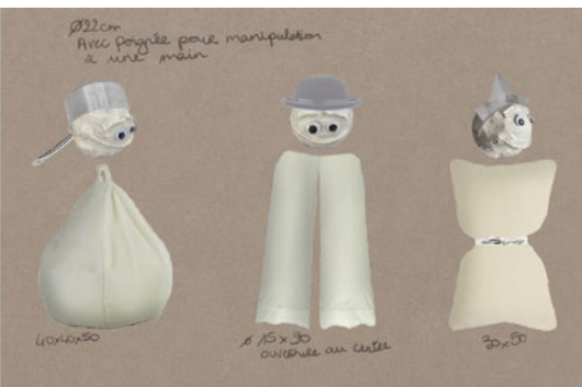
documents de travail - illustrations © marine plasse

La rêverie est visuellement sensibilisée par la délicatesse des matières. La métamorphose est enclenchée par les jeux d'apparitions des éléments scénographiques : décors, accessoires, costumes, marionnettes, tissus. Facile : les boîtes deviennent cailloux, les tissus, rivières, le lit, cabane. Les boîtes contiennent les éléments du rêve, ils prennent vie et nous racontent.